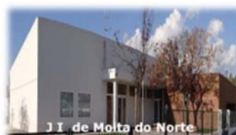
J I de Molta do Norte