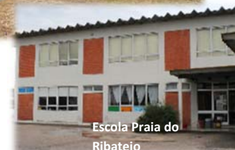
Escola Praia do Ribatejo