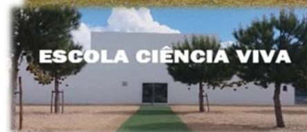
ESCOLA CIÊNCIA VIVA